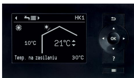
Wyświetlacz regulatora pompy ciepła Vitotronic 200